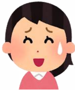
特別支援学級担任