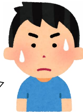
通級指導教室担当