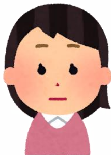
特別支援学級担任