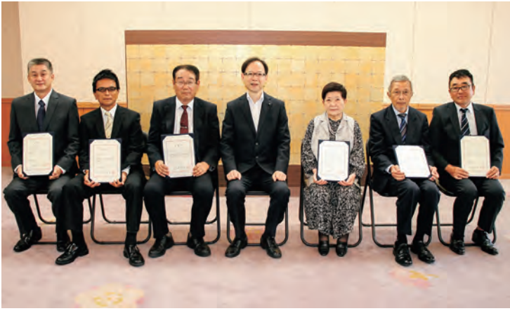
認知症本人大使「大分県希望大使」委嘱状交付式の様子