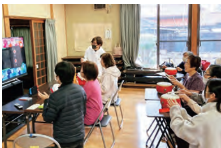
通いの場で太鼓の達人を楽しみ高齢者 (太鼓の達人 ドンダフルフェスティバル)