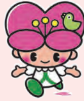
大分県人権啓発 イメージキャラクター-こころちゃん