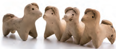
犬形土製品 (国指定重要文化財・埋蔵文化財センター蔵)

犬形土製品は大阪を中心とした近畿地方で作られ、大分市にある中世大友府内町跡でも多数が出土しています。一度にたくさんの子どもを産む犬にあやかり、安産を祈るために作られたといわれています。