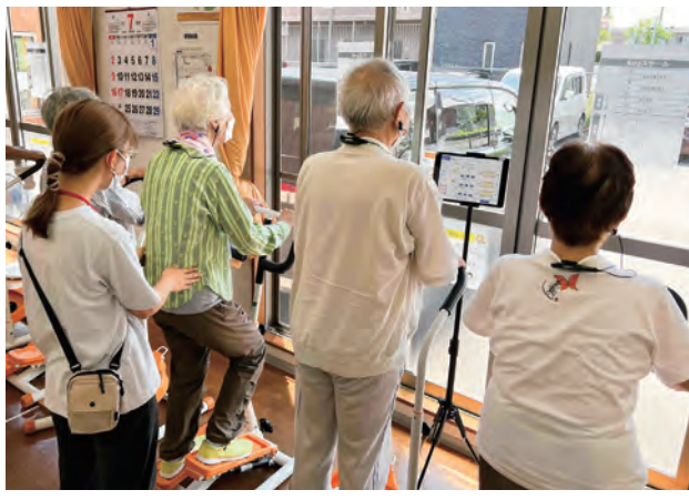
短期集中予防サービスでの運動の様子

左の図①～⑤のうち3つ以上の項目に当てはまり、日常生活に困りごとのある方は「短期集中予防サービス」の利用を相談してみましょう。