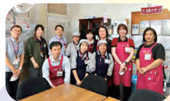
スーパー店員向け認知症サポーター養成講座の様子

「認知症かもしれないが、どこに相談したらよいかわからない」「家族の認知症の症状で困っている、対応方法を知りたい」「地域の中で認知症に関する学習会を開きたい」などお住まいの地域の推進員にご相談ください。