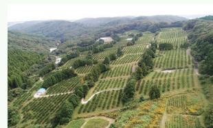
国東市 カボス団地