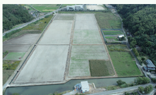
豊後高田市 白ねぎ団地

県・市町・農業関係団体で構成された推進体制のもと、県内に概ね10ha以上の大規模園芸団地を2024~33年までの10年間に10団地以上、新たに整備することを目標に取り組んでいます。