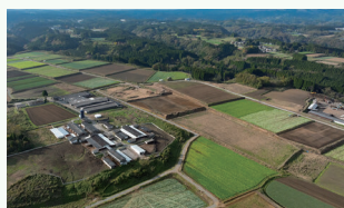
竹田市 スイートコーン キャベツ団地