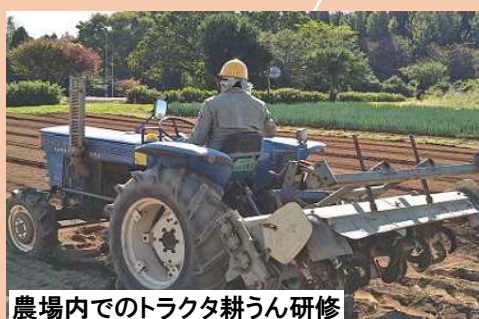
農場内でのトラクタ耕うん研修