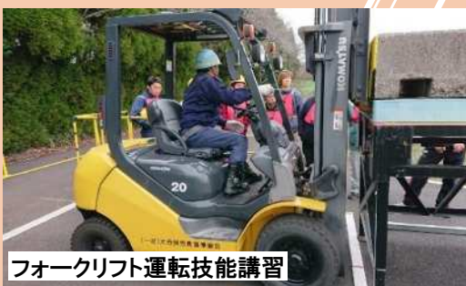
フォークリフト運転技能講習