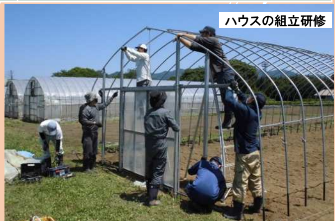
ハウスの組立研修