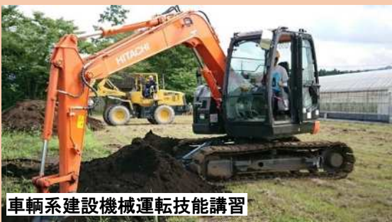
車輛系建設機械運転技能講習