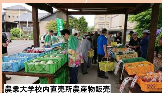
農業大学校内直売所農産物販売