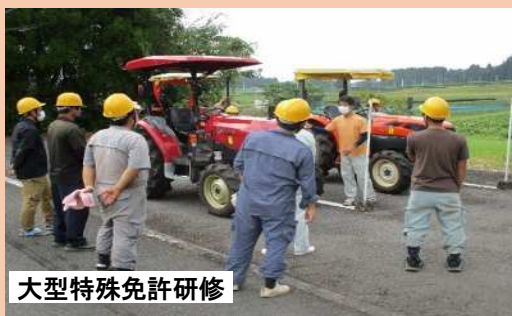
大型特殊免許研修