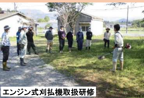
エンジン式刈払機取扱研修