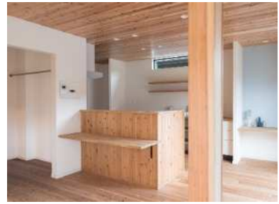
対面キッチンへのリフォーム事例