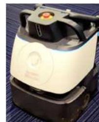
自動掃除機ロボット