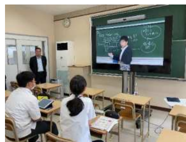
高等学校における遠隔授業