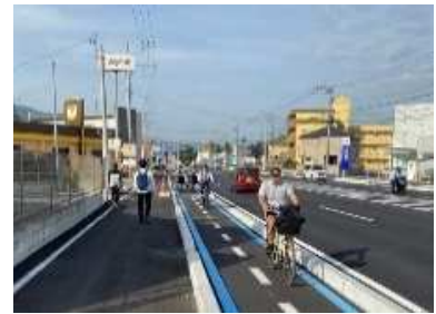
自転車通行空間の整備状況