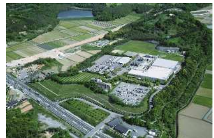
中津市の半導体企業