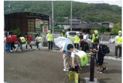
自主防犯パトロール隊による こどもの見守り活動