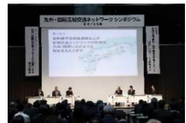
九州・四国広域交通ネットワークシンポジウム