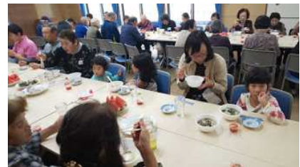
こどもから高齢者まで 多世代にわたる交流