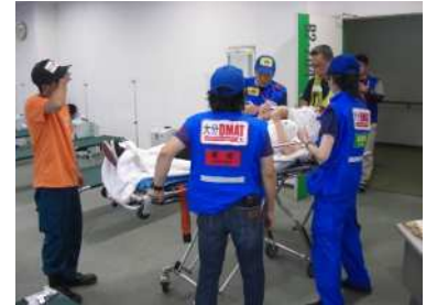
DMAT(災害派遣医療チーム)訓練の様子