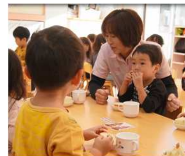
県内で活躍する保育士