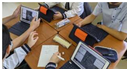
1人1台端末を活用した 「総合的な探究の時間」