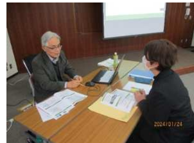
専門家(運営アドバイザー)による支援