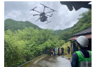
ドローンによる全国初の発災直後の 救援物資配送(令和5年7月)