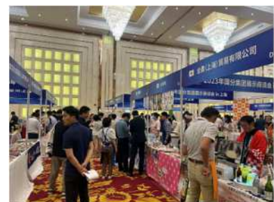
上海市での県産品展示商談会