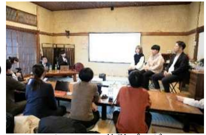
ワーケーション体験プログラム