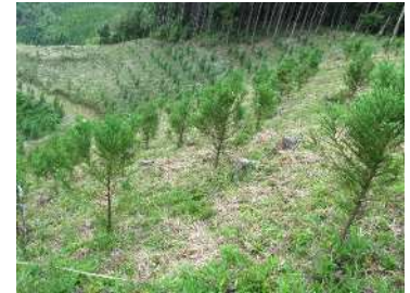
着実な再造林による 吸収源の持続的な確保