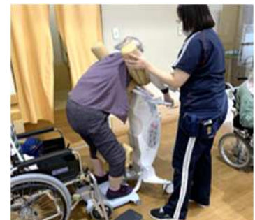
介護ロボットによる移乗支援