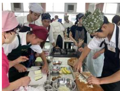
バランスの良い食事の学習 (津久見高校)