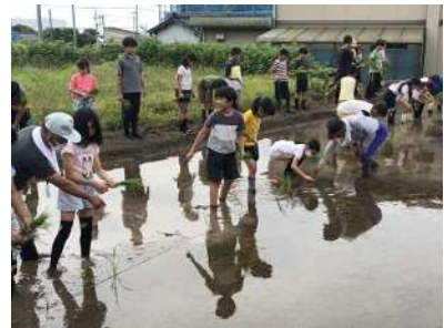
地域学校協働活動「田植え体験」