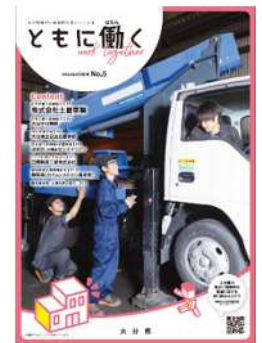
定期情報誌「ともにおもに働く」 (発行:大分県)