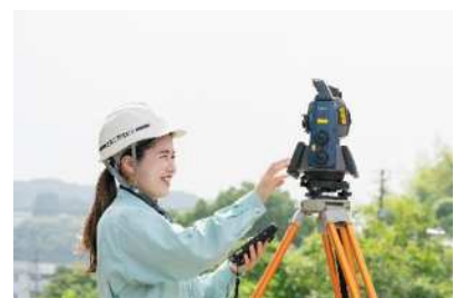
女性のロールモデル紹介 (建設産業で活躍する女性)