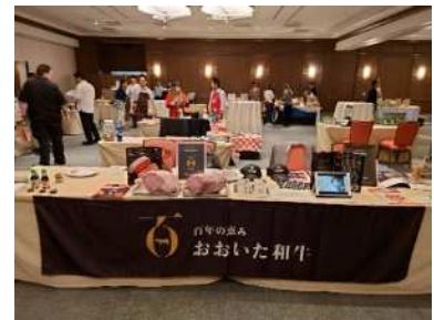
販路拡大に向けた農産物フェア