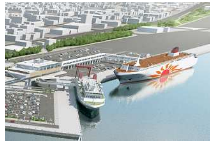
別府港の再編イメージ