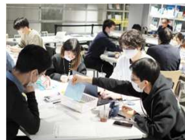
「dot.」での若年者の県内就職支援