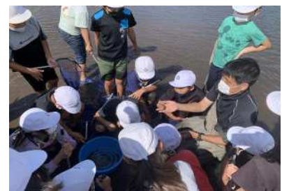
大分県環境教育アドバイザー派遣事業