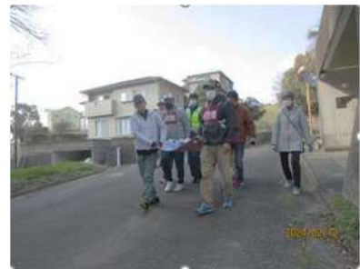
自主防災組織による避難訓練