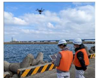
港湾施設点検における ドローンの活用