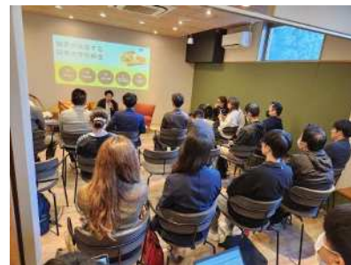
起業家や経営者のコミュニティイベント