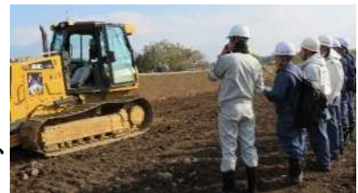
地域産業界の協力による インターンシップ