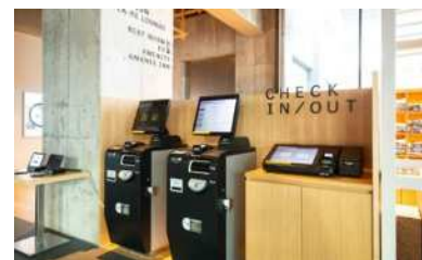
自動精算システム