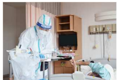
感染症入院患者の看護(県看護協会)