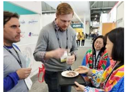
ボストン市での農産品PR