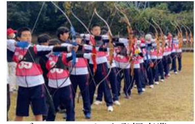
ジュニアアスリート発掘事業 (アーチェリー体験)