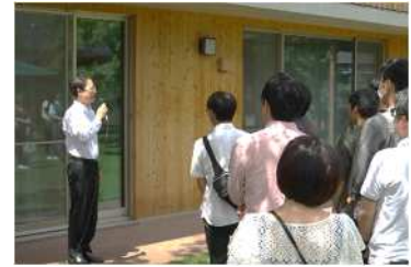
婚活イベント(知事公舎)