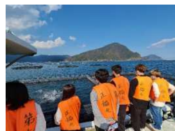
水産業の現場を学ぶフィールドワーク (日本文理大学)