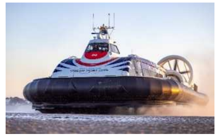
ホーバークラフト(Banri)