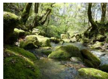
鳴子川溪谷(九重町) (おおいたの重要な自然共生地域)