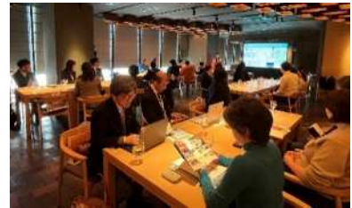
九州横断3県長崎・熊本・大分 観光プロモーション