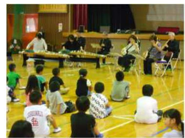
文化キャラバンによる鑑賞機会の提供