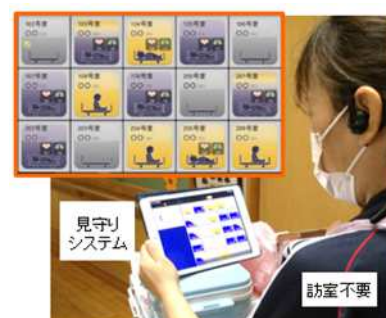
離床センサーと接続した見守りシステム