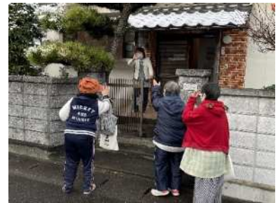
グループホームからの出勤の様子