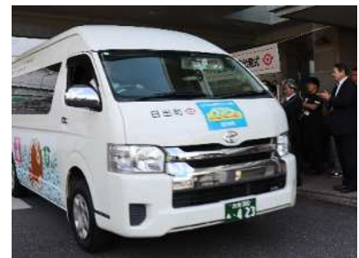
AIを活用したデマンドタクシー