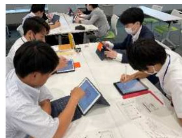
教員の ICT 研修