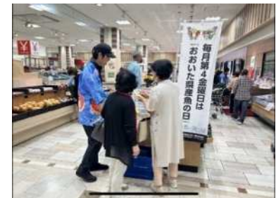
魚食を推進する「おおいた県産魚の日」の取組