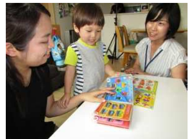
ホームスタート(家庭訪問型支援)