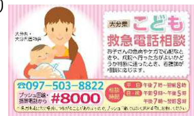
こども救急電話相談