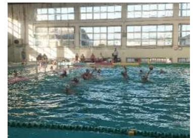
ハンガリー・アメリカ 女子水球代表の県内合宿