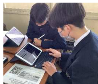
生成 AI の活用に取り組む高校の様子(文部科学省指定校)