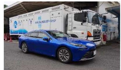
水素ステーションと 燃料電池自動車