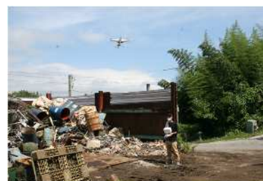
ドローンによる 廃棄物処理場の空撮状況