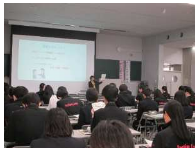
高校生を対象とした消費生活啓発講座