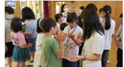
台湾からの訪日教育旅行