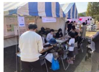
地球温暖化防止活動学生推進員の取組