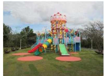
ハーモニーパーク(日出町)