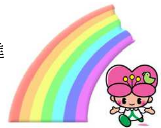
大分県人権啓発イメージキャラクター 「こころちゃん」