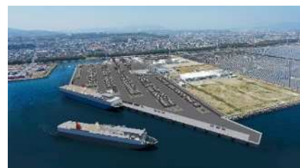
大分港大在西地区の完成予想図