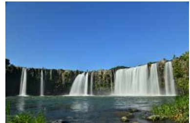
おおいた豊後大野ジオパーク 原尻の滝(豊後大野市)