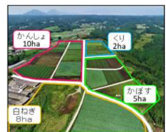
園芸団地のイメージ