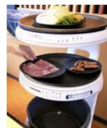
自動配膳ロボット