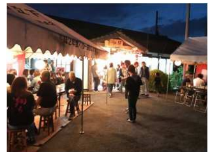
コミュニティビジネス (駅を活用した飲食イベント)