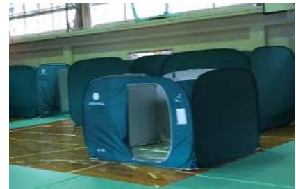
プライバシー等に配慮した避難所