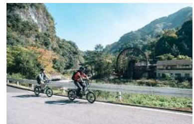
番匠川サイクリング