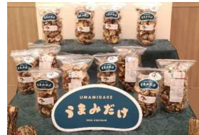
県産ブランド「うまみだけ」