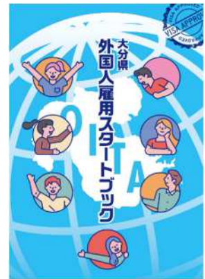
県内企業向け 外国人雇用リーフレット