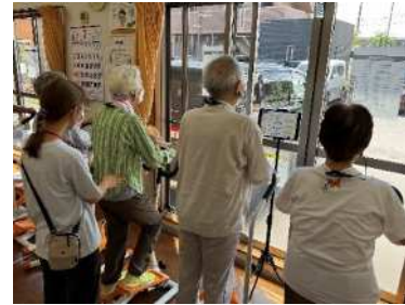
短期集中予防サービス