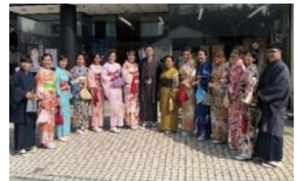
日本語パートナーズ研修