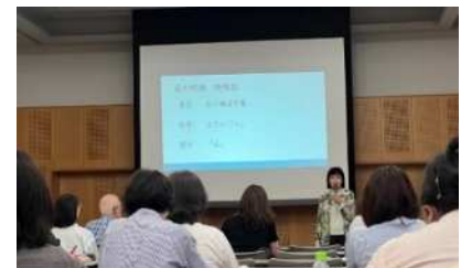
日本語人材スキルアップ研修