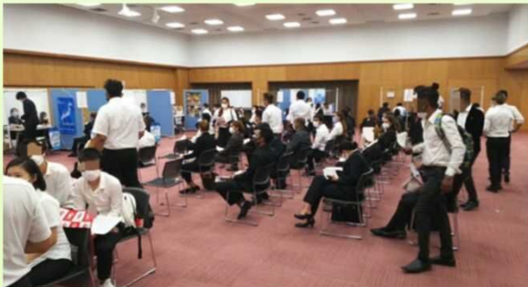
説明会の大会場の様子

今後とも、できる限り企業と留学生のマッチングの機会、留学生に大分県の企業を知ってもらう機会を増やし、県内に就職したいという留学生の夢を一人でも多くかなえることができるよう、合同企業説明会やオンライン企業説明会、企業見学会、個別相談等を実施し、留学生の県内就職促進を図っていきます。