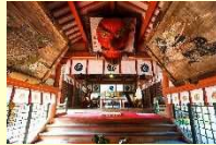
(大分市) 杵原八幡宮 (ゆずはらはちまんぐう)