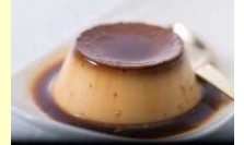
(別府市) 地獄蒸しプリン