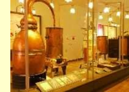
(別府市) 香りの森博物館