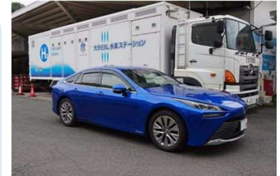
水素ステーションと燃料電池自動車