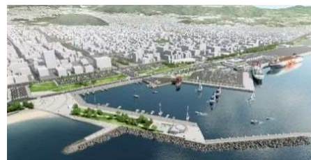
別府港再編イメージ図