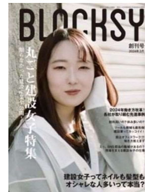
建設産業で活躍する女性を紹介する冊子「BLOCKSY」