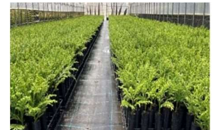
整備の進む早生樹育苗施設