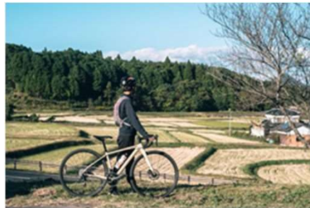
豊後高田市のアドベンチャー ツーリズムコース