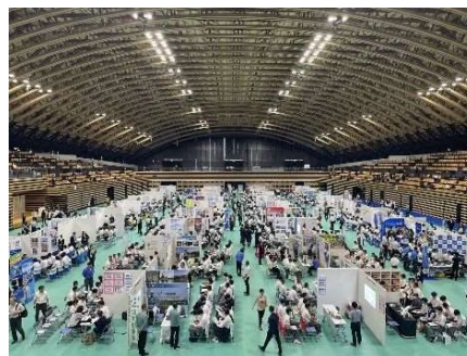
高校生向け企業説明会