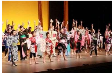
地域の芸術文化活動