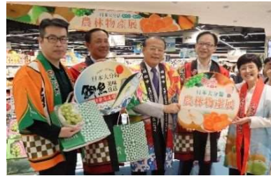
台湾プロモーション