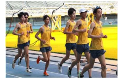
大学チームのスポーツ合宿