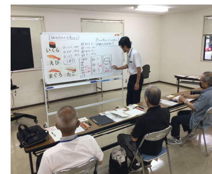
夜間中学模擬教室