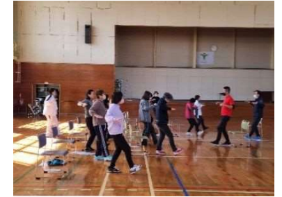
総合型地域スポーツクラブでの活動