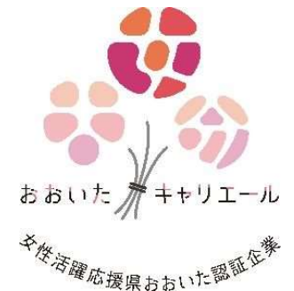
女性活躍応援県おおいた認証企業 (愛称:おおいたキャリアール) ロゴマーク