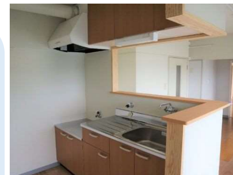
子育て世帯向け住戸の整備 (対面キッチンへの改修事例)