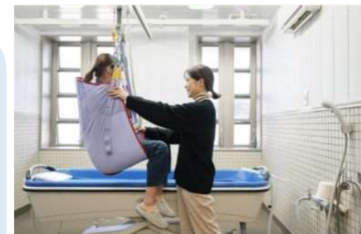
ノーリフティングケア (抱え上げない介護)