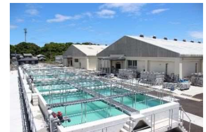
新たに整備した種苗生産施設