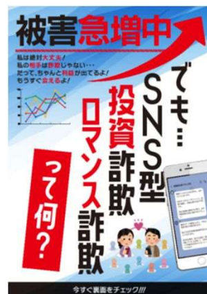
詐欺被害防止広報啓発