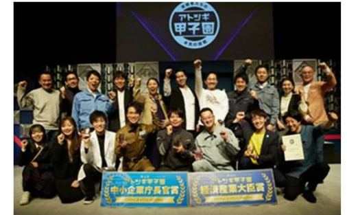
アトツギ甲子園決勝大会