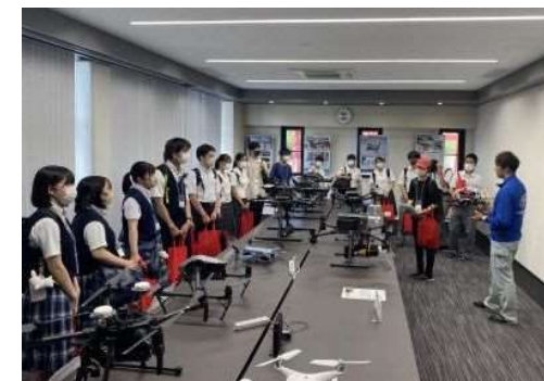
理工系人材育成に向けた企業訪問