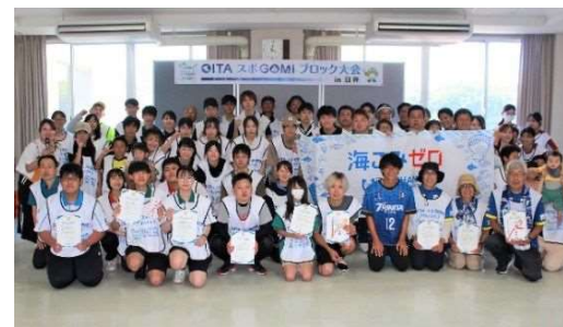
OITA スポGOMI ブロック大会