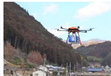
ドローンによる孤立集落への救援物資配送訓練