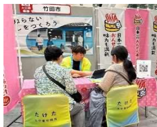
東京での移住相談会