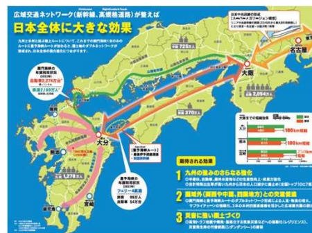
広域交通ネットワーク