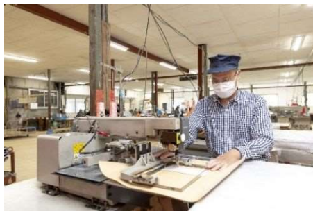
縫製現場での就労の様子