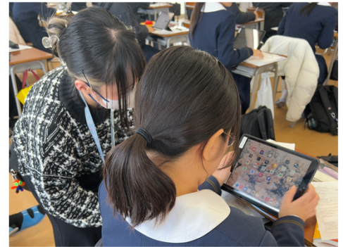
生徒を支援するICT教育サポーター

○市町村や私立学校も活用可能。 ※令和5年度から、2市町と私立3校も活用している