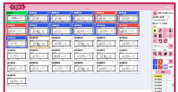
設問ごとの切り出し採点