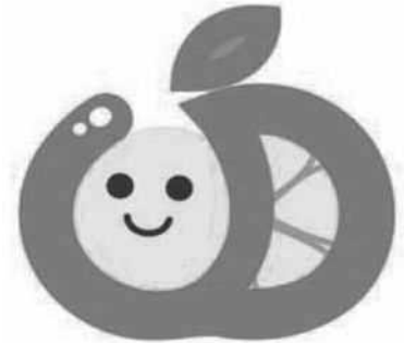
[ユニバーサルデザイン シンボルマーク]