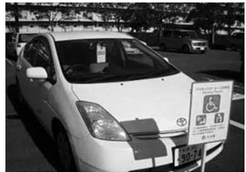
[あったか・はーと駐車区画]

平成30（2018／）年6月に県が行った「人権に関する県民意識調査」では、「今の日本で、人権は尊重されていると思うか」という質問に対して、「尊重されている・どちらかと言えば尊重されている」と回答した人が71.8%となっており、前回調査