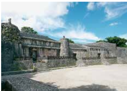
五陵 琉球王国の王族の墓 【所在地】那覇市 【連絡先】098-885-2861 那覇市文化財課協力