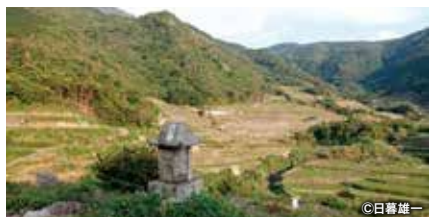
春日集落と安満岳 春日集落と安満岳