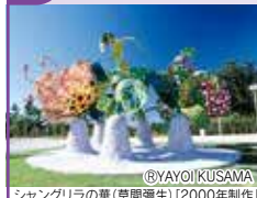
シャングリラの華(早間彌生)「2000年制作」 ©YAYOI KUSAMA