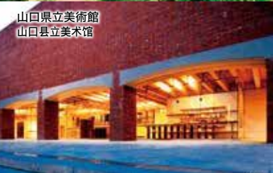
山口県立美術館 山口县立美术馆