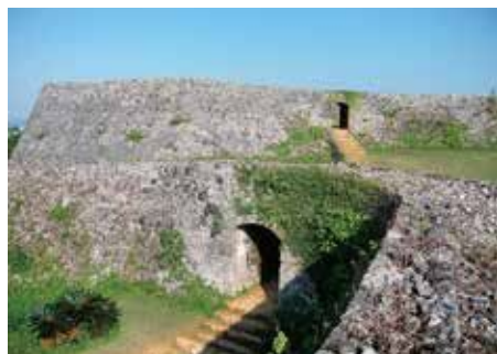
座喜味城跡 護佐丸が15世紀前半に造った城