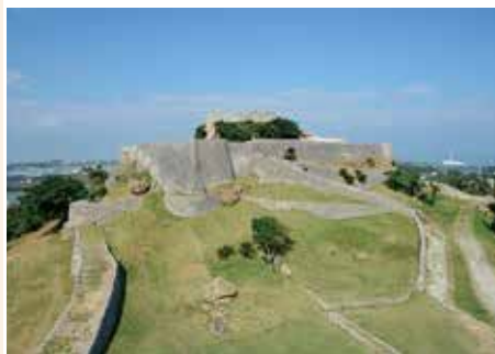
勝連城跡 勝連城主阿麻利和が住んでいた城