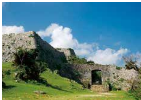
中城城跡 護佐丸が勝連城主の攻撃に備え築城した城