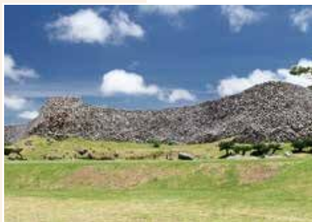
今帰仁城跡 沖縄本島北部を治めていた王が住んでいた城