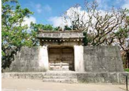
園比屋武御嶽石門 国王が出かける時に、旅の安全を祈った場所 【所在地】那覇市 【連絡先】098-917-3501 那覇市文化財課協力