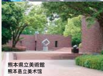
熊本県立美術館 熊本县立美术馆