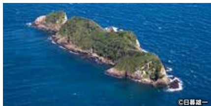
中江ノ島 中江ノ島

平戸圣地と集落（春日集落、安満岳、中江ノ島） 以山岳及岛屿作为圣地及殉教地进行崇敬的同时，秘密持续坚持信仰的集落