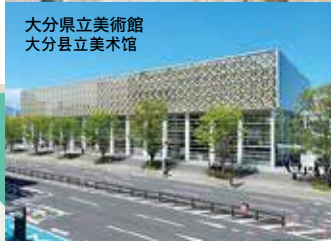
大分県立美術館 大分县立美术馆