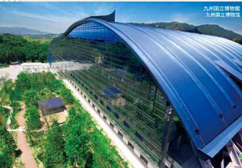
九州国立博物館 九州国立博物馆