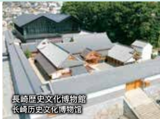
長崎歴史文化博物館 长崎历史文化博物馆