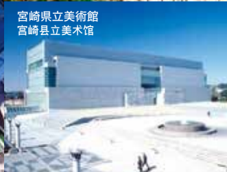
宮崎県立美術館 宫崎县立美术馆