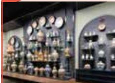
陶器コレクション(有田町所蔵)