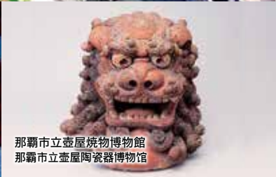
那覇市立壺屋焼物博物館 那覇市立壺屋陶瓷博物馆