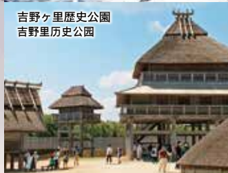
吉野ヶ里歴史公園 吉野里历史公园