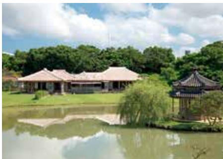
識名園 王族の別邸で中国の冊封使をもてなした場所 【所在地】那覇市 【連絡先】098-855-5936 那覇市文化財課協力