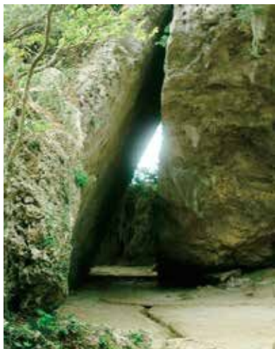
高場御嶽 琉球王国時代、祈祷や儀式を行った聖地 【所在地】南城市 【連絡先】098-949-1899 南城市教育委員会協力