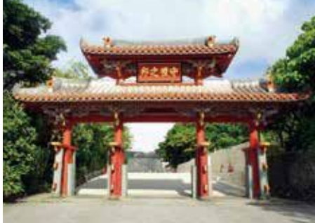
首里城跡 琉球国王が住んでいた城で政治文化の中心地 【所在地】那覇市 【連絡先】098-886-2020 (一財)沖縄美ら島財団協力