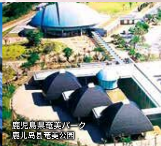
鹿児島県奄美パーク 鹿儿岛县奄美公园