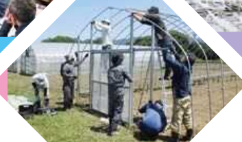
ハウス組立て研修