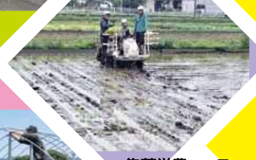
集落営農コース 田植え作業