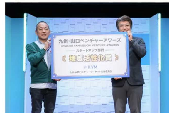
株式会社おおいたCELEENA（大分）

（出所：KVMホームページ https://kyushu-yamaguchi-vm.jp/ ）