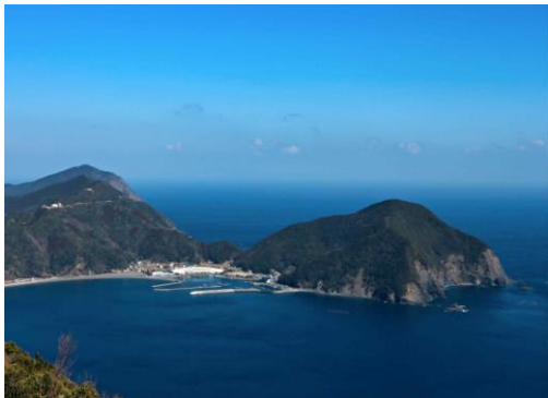
元猿湾と蒲江のまちなみ