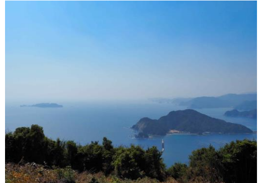
展望台から望む離島