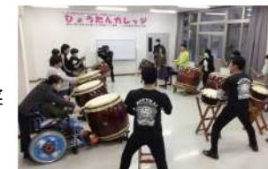
生涯を通じた障がい者の学びの支援「ひょうたんカレッジ」