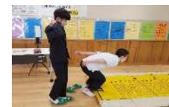
運動の習慣化・日常化に向けた1校1実践「校内に体力測定コーナーを設置」