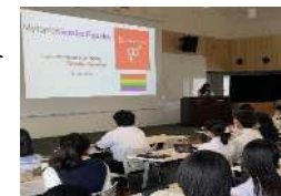
グローバルリーダー育成塾