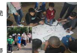
学校防災出前講座「防災マップの作成」