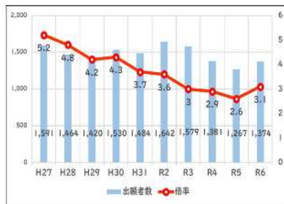
教員採用選考試験における出願者数・倍率の推移