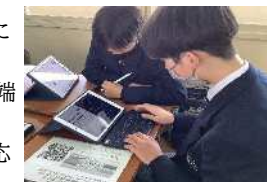
生成AIの活用に取り組む高校の様子（文部科学省指定校）