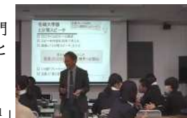
人間関係づくりプログラム