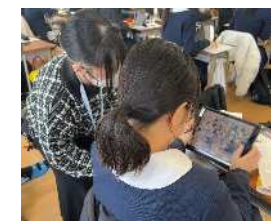
私立高校のICTサポーター