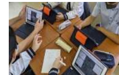
1人1台端末を活用した「総合的な探究の時間」