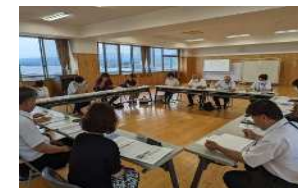
学校運営協議会(日出町立豊岡小)