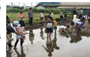
地域学校協働活動「田植え体験」