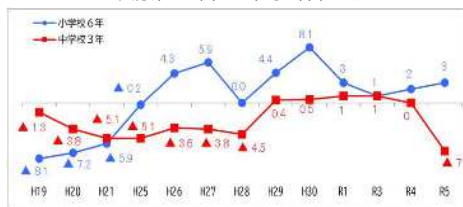
令和5年全国学力・学習状況調査 大分県と全国との平均正答率の差