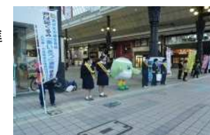
青少年育成団体等による県一斉あいさつ運動