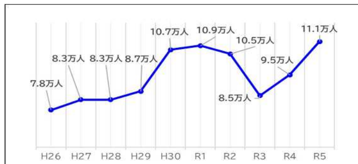
「協育」ネットワークの取組に参加する地域住民数推移