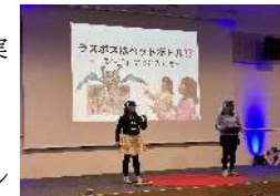
プレゼンテーションコンテスト