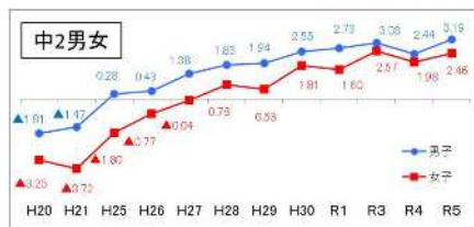
令和5年全国体力・運動能力、運動習慣等調査 大分県と全国との体力合計点（平均値）の差