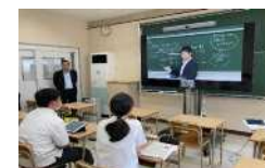
高等学校における遠隔授業