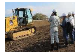
地域産業界の協力によるインターンシップ