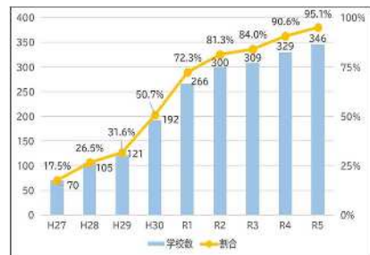
大分県CS導入学校数の推移(小・中・義務教育学校)