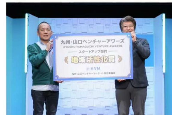
株式会社おおいたCELEENA（大分）