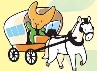
由布市のマスコット ゆーふー