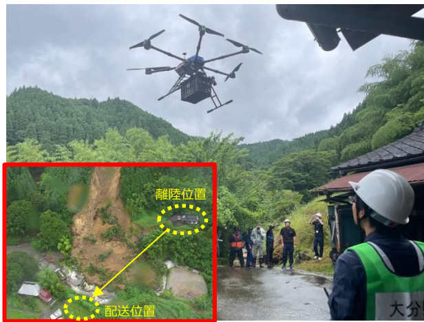
全国初となる発災直後の救援物資配送の様子