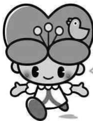
大分県人権啓発イメージキャラクター こころちゃん

こころちゃんの部屋においてよ！ こころちゃんの部屋 で検索 http://www.pref.oita.jp/site/kokoro/