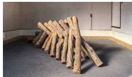
三枝愛 庭のほつれ|なばに祈る 2022

開催日／2022年11月5日(土)～20日(日) 会場／ドマコモンズ(別府市) 来場者数／70人 主催／庭のほつれ実行委員会