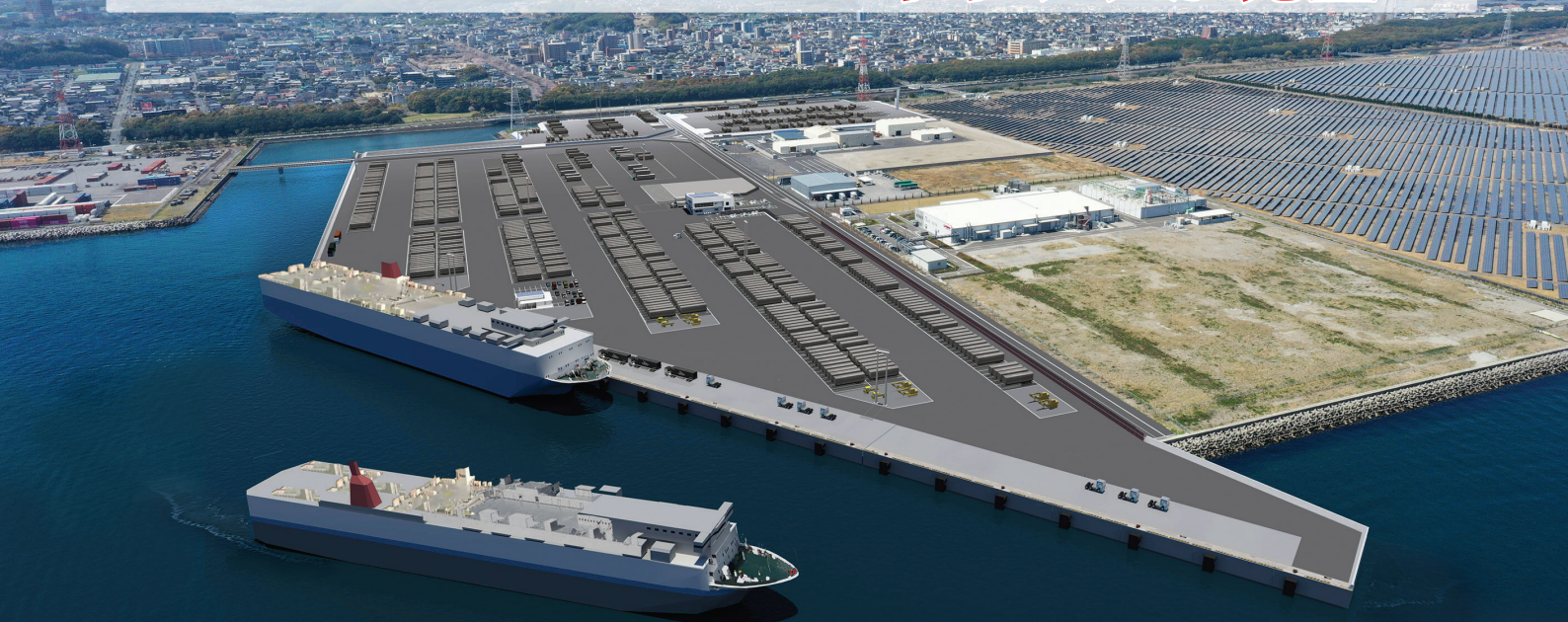
大分港新RORO船ターミナル完成予定図