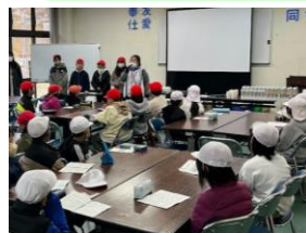
ステップ③ 森づくりを体験する活動