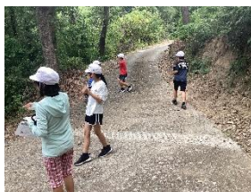
ステップ① 森に触れ親しむ活動