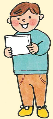
だい 大ちゃん 歴史好きのしっかり者。