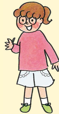
ケイちゃん スイーツが大好き。