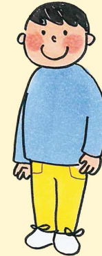
カン太くん おにぎりが好物の 食いしん坊。