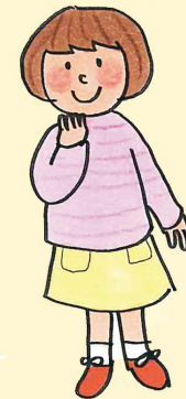
とよ 豊ちゃん 旅行が大好き。