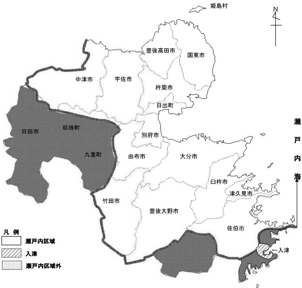
図 水質10 瀬戸内区域及び入津