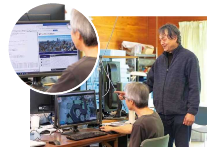
▲パソコン作業をマンツーマンで指導