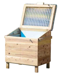
▲土中のバクテリアの力で生ゴミを分解する「なかつキエーロ」

5年前に元有名IT企業の社員が入社したことで、IT関連の作業の受注も始めました。タイピング、ワード、エクセル、プログラミング、デザインなどその人の適性、興味に合わせた指導を行います。精神障がいの人の中には元SEもいますし、障がい者たからでないのは当てはまりません。職業指導員さんの言葉通り、中津市コミュニティバスのデータ管理、バス停の位置変更に伴う地図上への落とし込み、時刻表アプリの開発、太陽の家への入浴管理システムの開発、企業・店舗のホーム