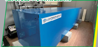
株式会社ハイドロネクスト

製造設備やインフラの安全を守る! 屋内に特化した国産の 産業点検用小型ドローン IBIS