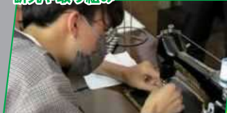
おおいた地域連携プラットフォーム