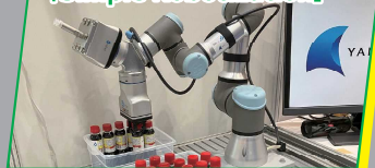
柳井電機工業株式会社

ロボットをより簡単に、 より多くの人へ ~[Simple Robotization]~