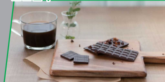
株式会社エコロジー