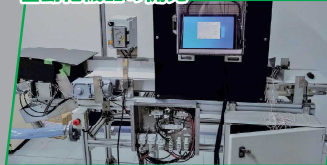
株式会社サン・ダイコー