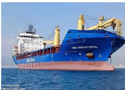
【貨物船 BBC SEBASTOPOL】

※大在公共岸壁付近は関係者以外の立入り制限を行っています。 安全確保のため、現地での取材対応については別途プレスリリースで お知らせいたします。