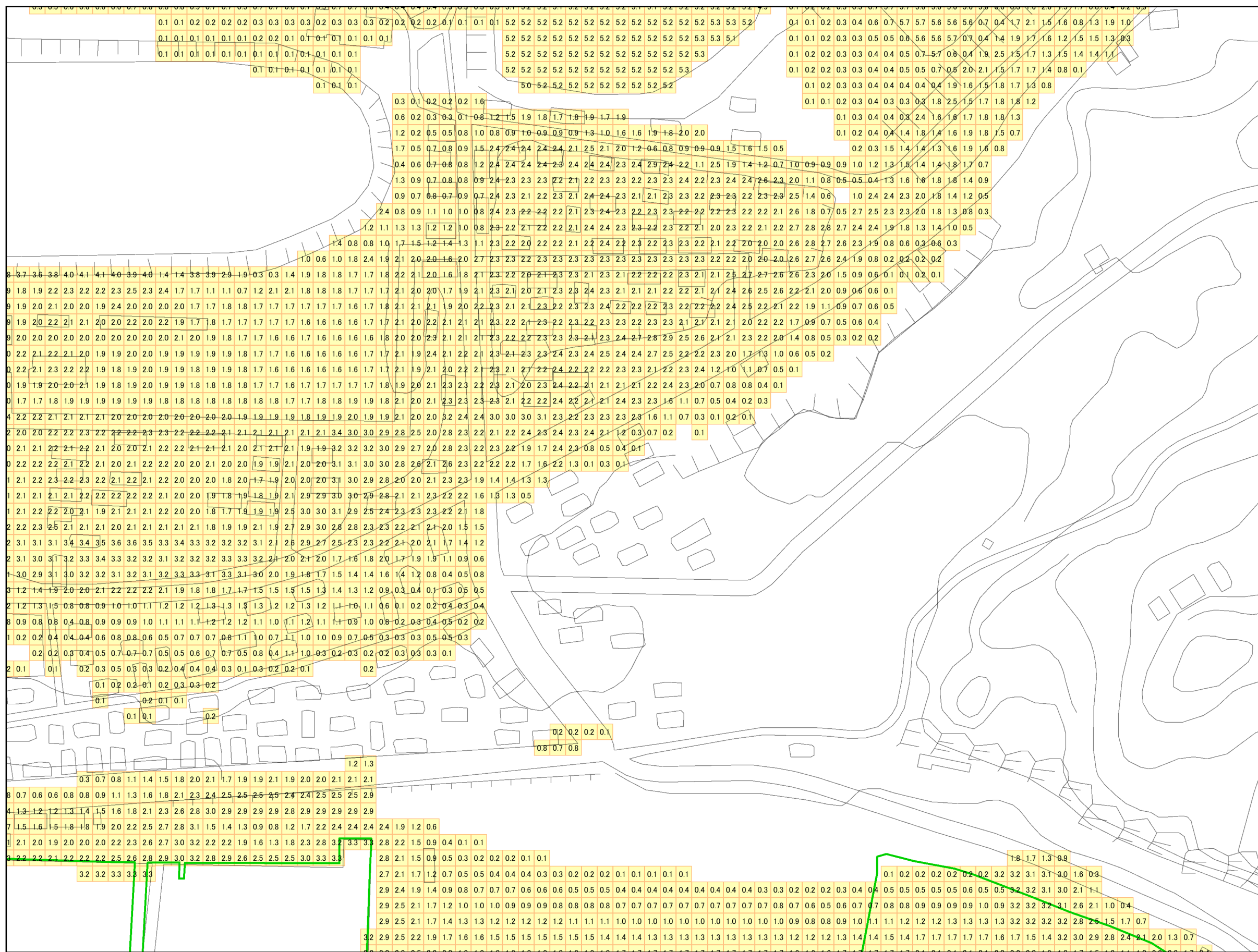
津波災害警戒区域 区域図