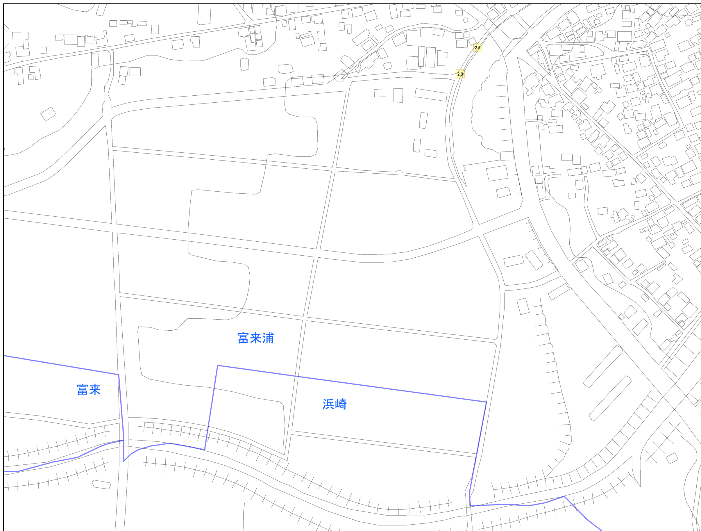
津波災害警戒区域 区域図