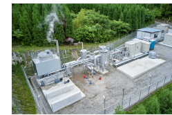
大分県産グリーン水素製造実証プラント @大林組