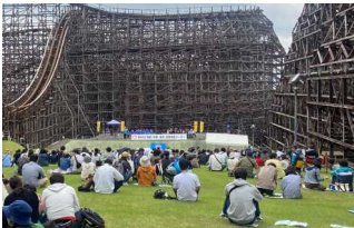
東部地区 中央集会の様子

※北部地区、西部地区については4月29日（土）に開催予定であったが、雨天により中止となった。