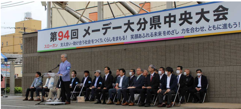
連合大分メーデー中央大会式典の様子

「支えあい・助け合う社会をつくり、くらしをまもる！笑顔あふれる未来をめざし力を合わせ、ともに進もう！」