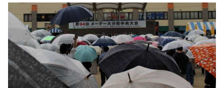
雨天の中多くの労働者が集まった

5月1日のメーデーに合わせて、連合大分（日本労働組合総連合会大分県連合会）は4月29日（土・祝）に「第94回メーデー大分県中央大会」を開催しました。新型コロナウイルス感染症感染拡大の状況を受けて近年はオンライン開催となっていました。今年からは2019年以来4年ぶりの集会形式による開催となりました。雨天での開催となりましたが、会場の大分市若草公園には約1,800人の組合員等が参加しました。