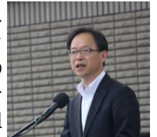
来賓あいさつをする佐藤樹一郎知事