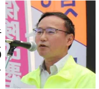
県労連メーデー 中央集会の様子