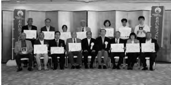
令和4年度おおいたうつくし作戦 功労者表彰受賞者