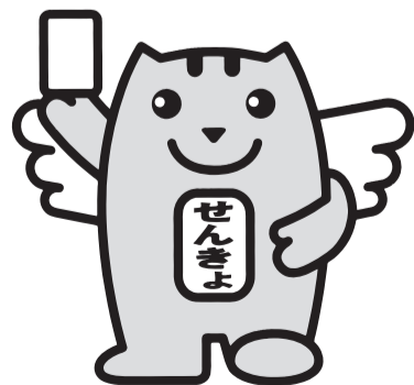
選挙のめいすいくん

期日前投票の期間 { 県知事選挙 3月24日(金)~4月 8日(土) } { 県議会議員選挙 4月 1日(土)~4月 8日(土) }