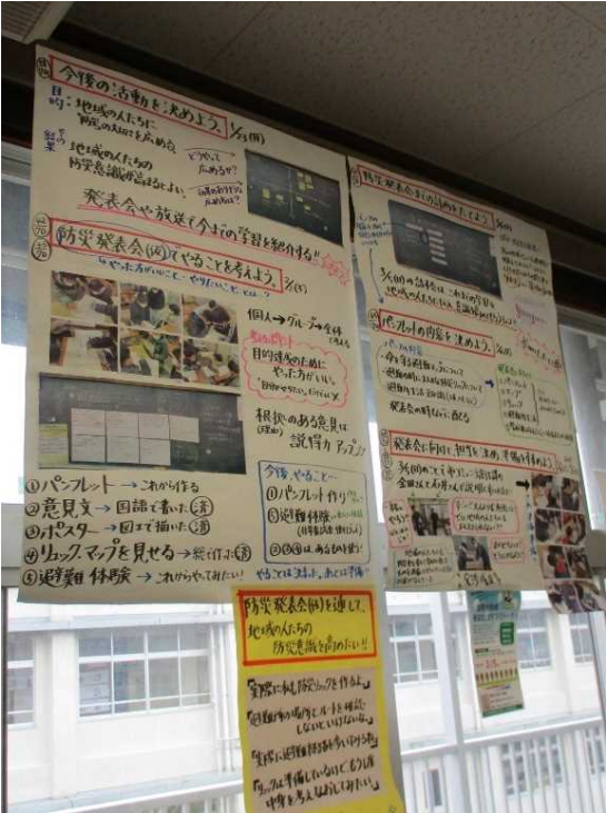
学びの履歴で思考・学びを確認