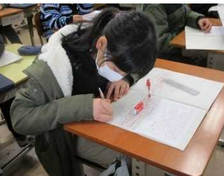
学びをじっくり振り返って書く