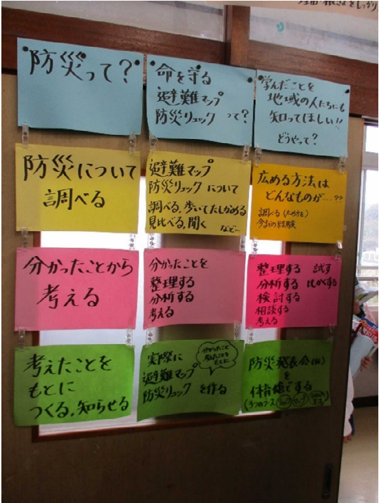
子どもと創り、共有した学習計画