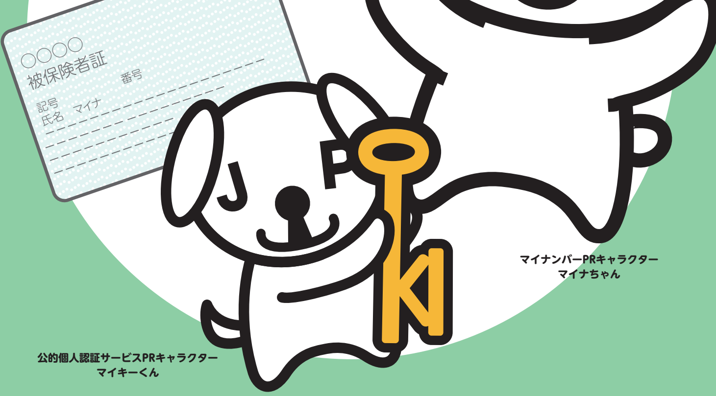
マイナンバーPRキャラクター マイナちゃん