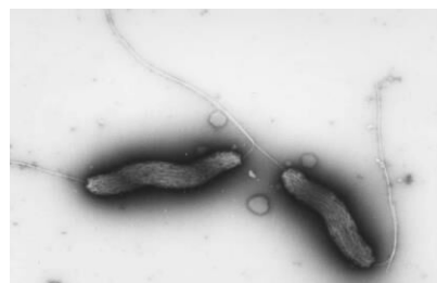
カンピロバクターの電子顕微鏡写真