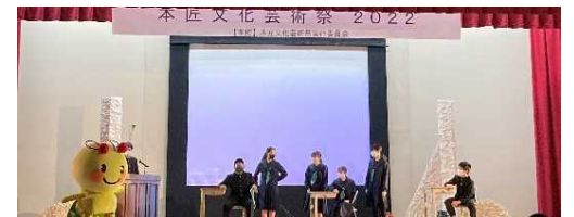
これまでの学びを劇やプレゼンテーションで発表（表現力の育成）、本匠の伝統芸能を継承する取組（地域貢献）