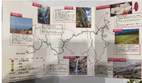
ガイドマップがなかったという課題から、本匠ガイドマップ（日本語版・英語版）を作成