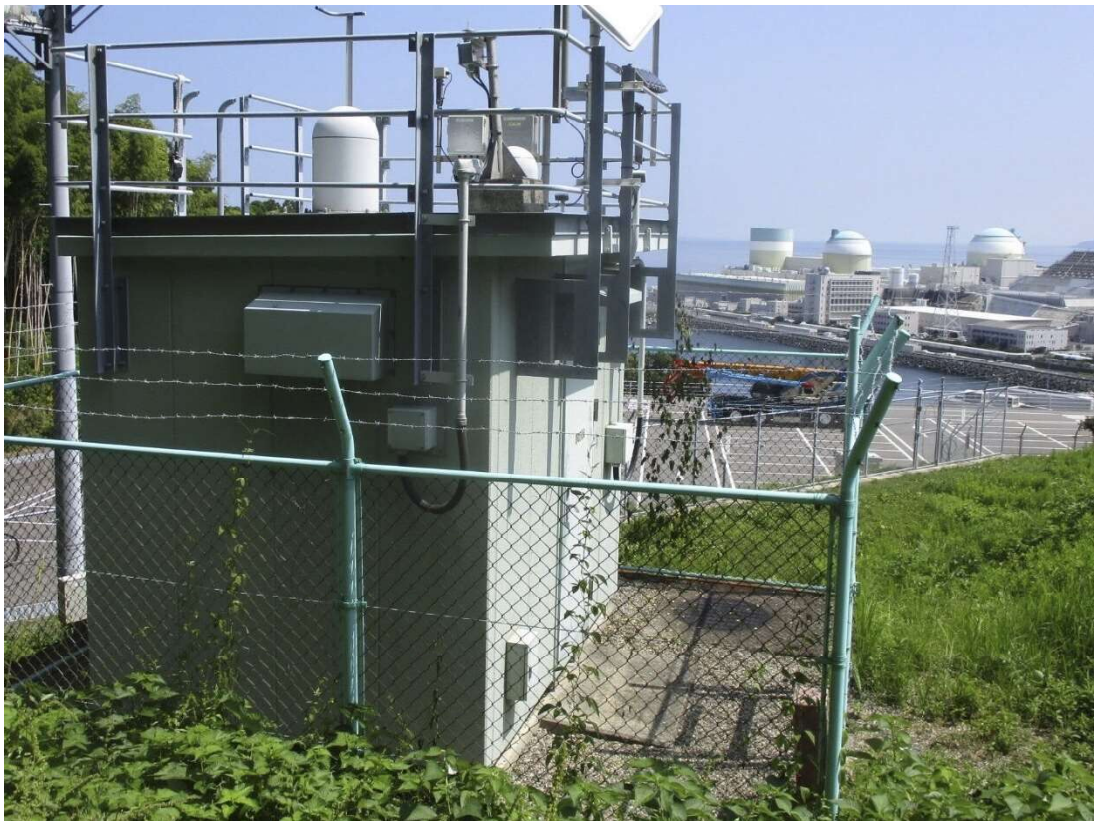
モニタリングポストの外観（写真はモニタリングポスト1）