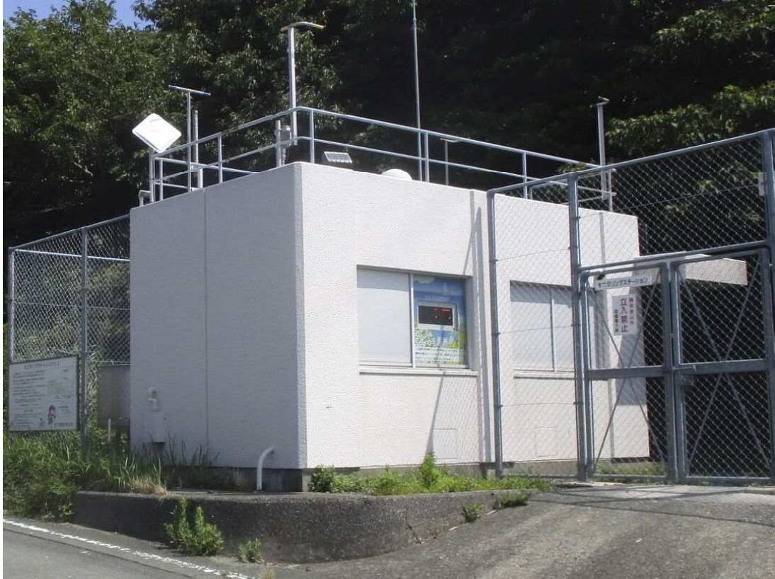
モニタリングステーションの外観