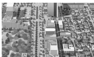
緑の適切な配置による良好な街並みの形成