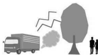
騒音等の吸収・大気汚染防止