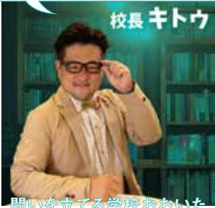
校長 キトウ SCHOOL PRINCIPAL

唯一の正しい答えを見つけるのではなく、そもそも論の語り合いを通して、皆さんの心により深い探究の火がつけます。「問いを立てる学校おおいた」はそんな場です、ぜひ。