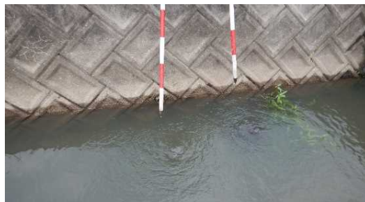
パイピングの状況。ポール先端(2箇所)