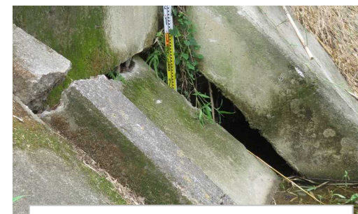
堤防張ブロックの破損(近景)