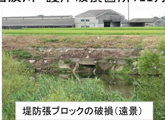
堤防張ブロックの破損(遠景)