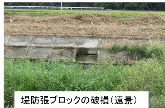
堤防張ブロックの破損(遠景)