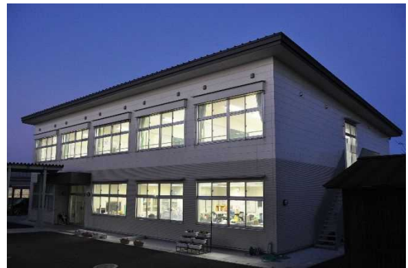
独立した定時制棟

や体育館、機械科の実習設備や商業科のコンピュータ室などは全日制と共用しています。