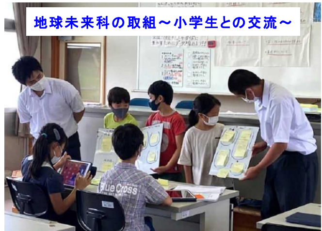
地球未来科の取組～小学生との交流～