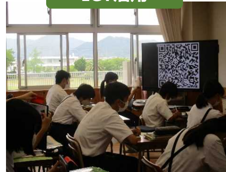
QRコードから本時に係る復習