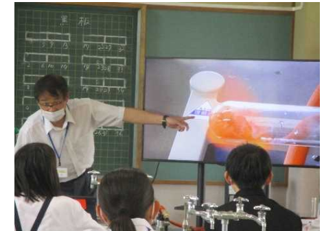
実験のゴールイメージを示す