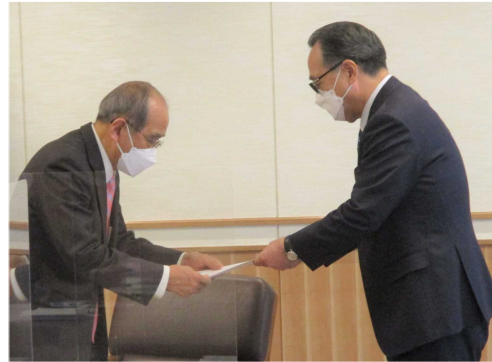
(左) 広瀬勝貞大分県知事 (右) 佐藤寛人連合大分会長

佐藤会長はあいさつの中で、2022春季生活闘争に関し、「すべての働く人たちの雇用の改善、賃金の向上に向け、力強い発信をしていきたい。」と述べ、広瀬知事に対し、5項目からなる要請書を手渡すとともに、最低賃金の引き上げに向けた取組への協力を求めました。