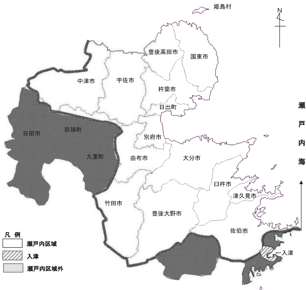
図 水質10 瀬戸内区域及び入津