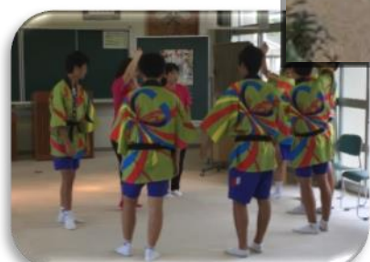
《伝統芸能に取り組む中学生》