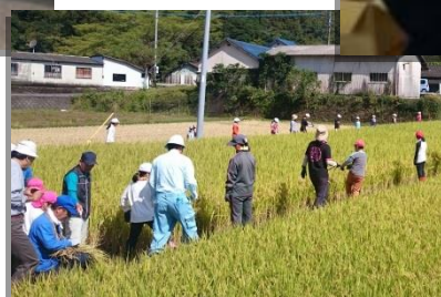
《稲刈り体験を行う小学生と地域住民》