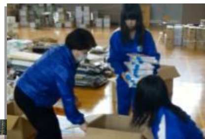
《被災地支援に取り組む高校生》