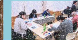
教頭の説明、資料、児童生徒の現状・課題をもとに熟慮