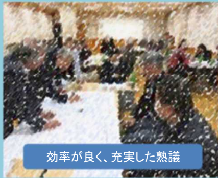
効率が良く、充実した熟議