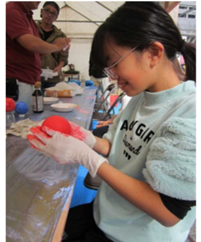
親子ふれあい広場の様子

会場を訪れた人々は、普段なかなか目にするのできない技能士の「わざ」に触れることができ、技能祭を通じてのものづくりに対する興味が深まったと話していました。