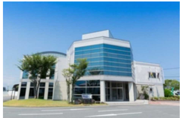
西日本土木株式会社（豊後高田市）

家にこもらず外に出ることが大切です。思い切って一歩踏み出せば新しい発見があると思います。