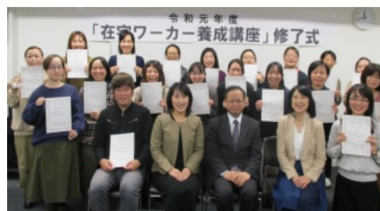
修了証を手にした受講生のみなさん