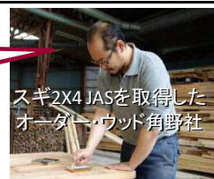
スギ2X4 JASを取得したオーダーウッド角野社

林業研究部の支援を受けスギ2X4 JASという新たな市場に県内第1号として参入できました。これからもスギ2X4 JASをはじめ、自社の強みを活かし、新市場開拓に積極的に取り組んで参ります。