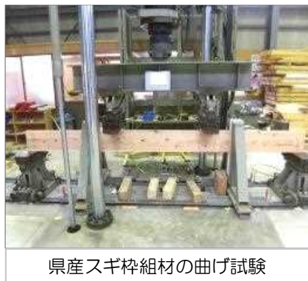
県産スギ枠組材の曲げ試験